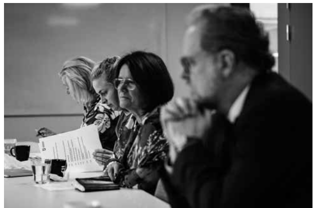
Insynsrådet besökte myndigheten i september.