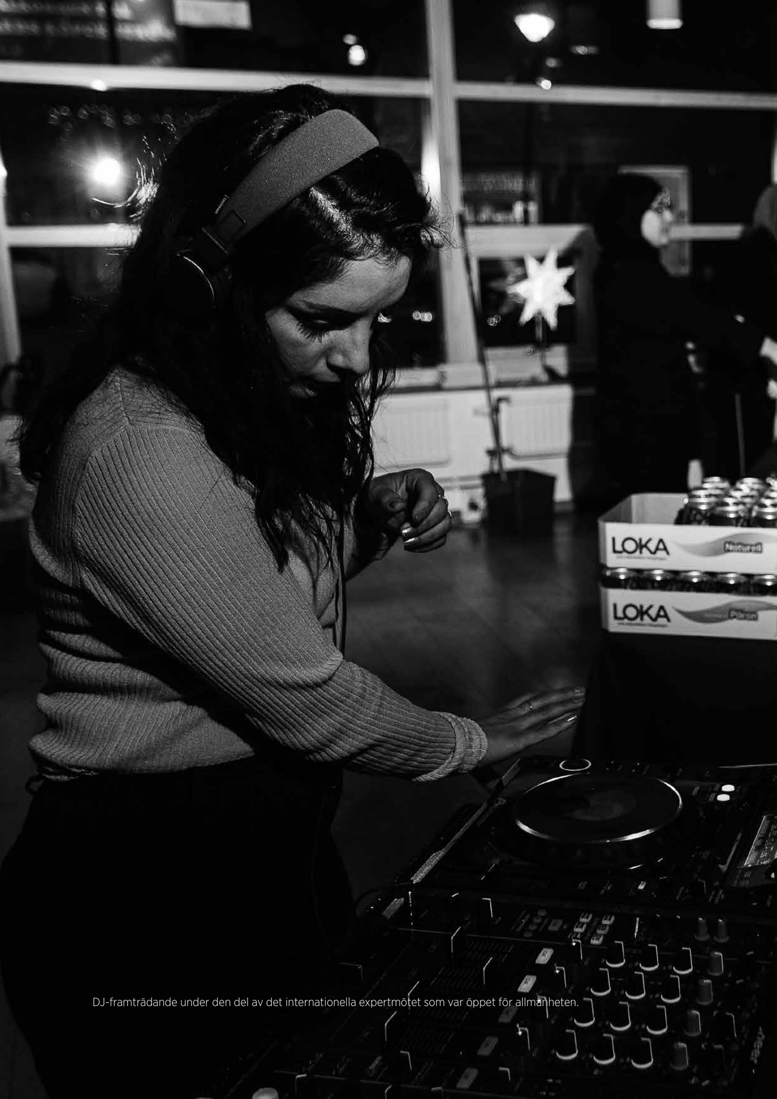
DJ-framträdande under den del av det internationella expertmötet som var öppet för allmänheten.