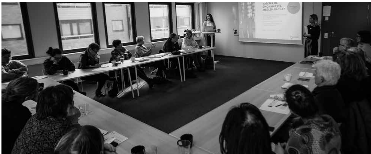
Informationsträffarna för civilsamhällets organisationer har varit uppskattade.

Myndighetens internationella verksamhet bedöms ha gett betydelsefullt stöd till regeringens prioriteringar internationellt inom jämställdhetsområdet, samt bidragit till ökad kunskap om svensk jämställdhetspolitik i omvärlden. Myndigheten har även inhämtat värdefull internationell kunskap till gagn för fortsatt utveckling av jämställdhetspolitiska insatser i Sverige.