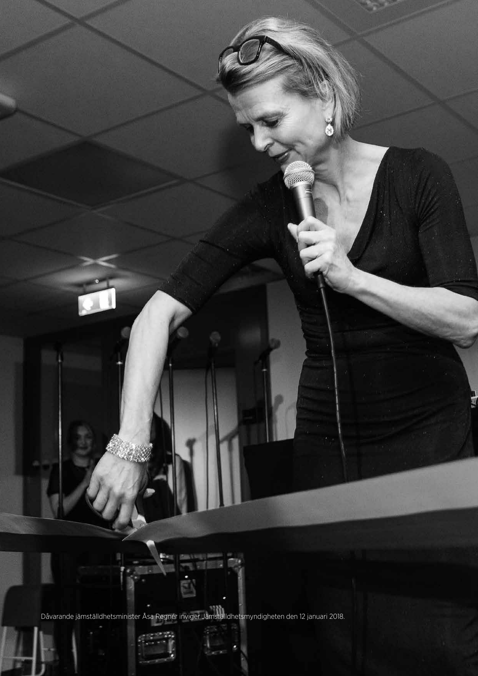
Dåvarande jämställdhetsminister Åsa Regnér inviger Jämställdhetsmyndigheten den 12 januari 2018.