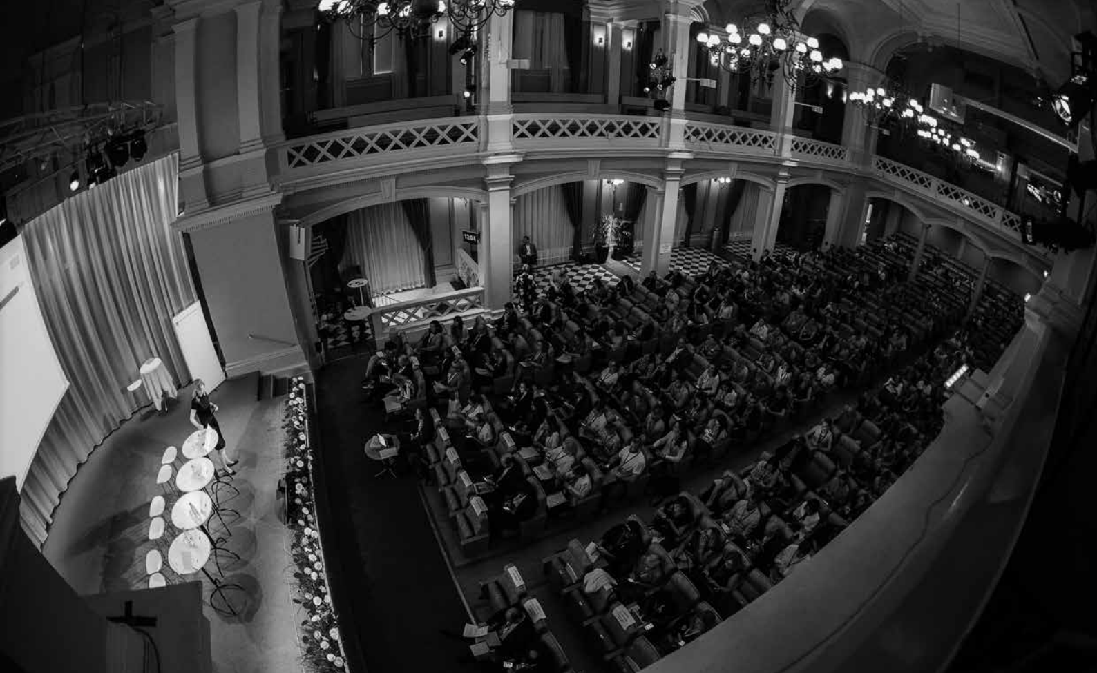
Konferensen ICMEO lockade 300 deltagare från en rad europeiska länder.

den, vilket inbegriper att initiera samverkan, kartlägga insatser och analysera utvecklingsbehov.