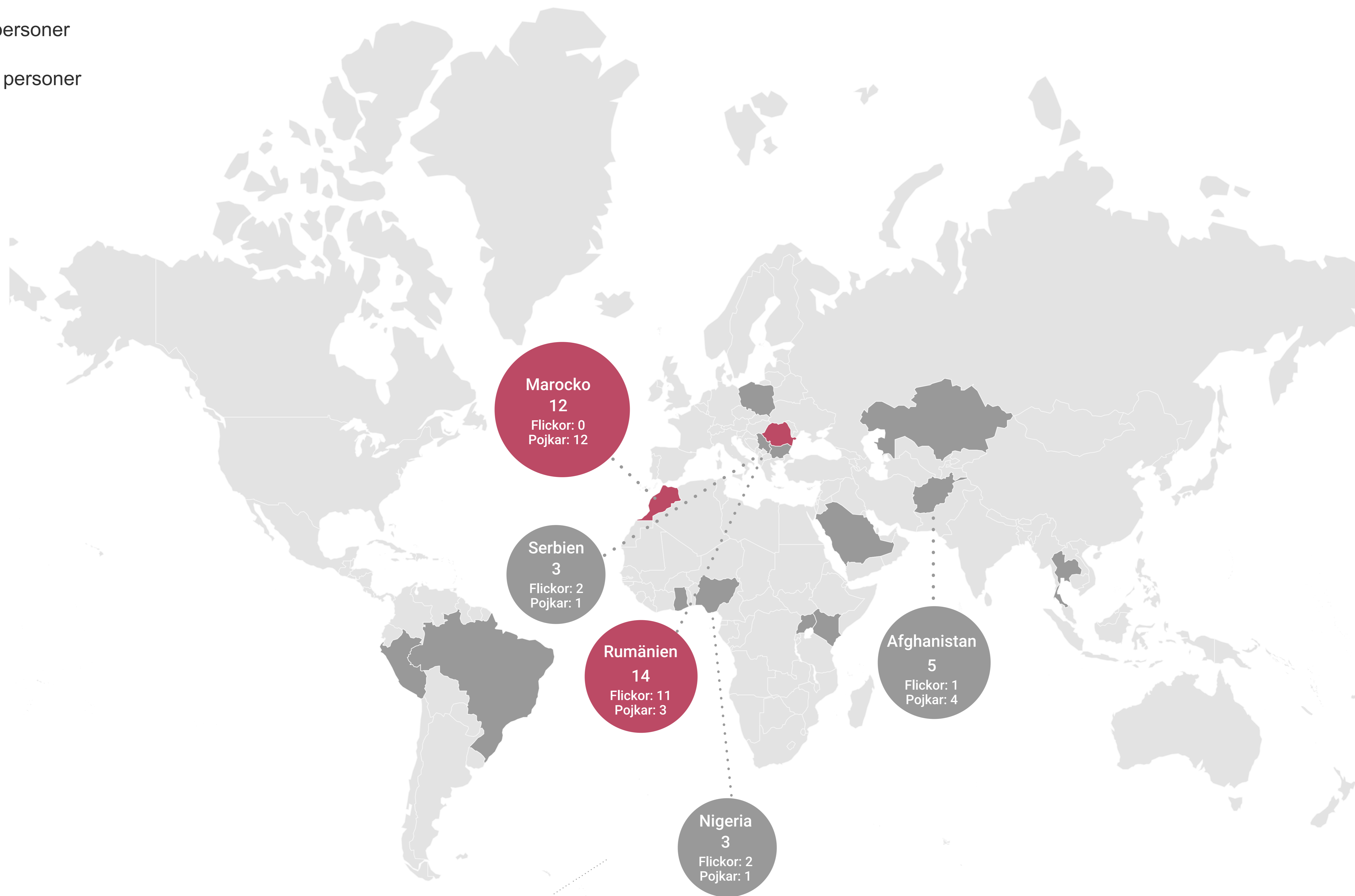
Ursprungsland för utsatta i Sverige

OBS! En person kan ha varit utsatt för flera former av exploatering