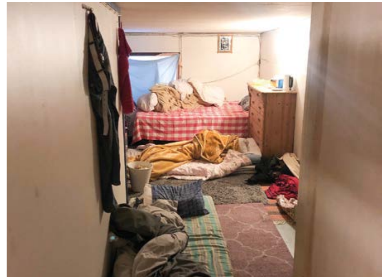
Bild 2. Boende på arbetsplats

Migrationsverket redovisar antalet misstänkta ärenden om människohandel som myndigheten kommer i kontakt med. Det är utsattheten som är i fokus, vilket innebär att siffrorna även omfattar individer som exploaterats utanför Sveriges gränser. Mellan 2017 och 2020 registrerades mellan 150 och 180 ärenden årligen som gällde människohandel för tvångsarbete. Mörkertalet bedöms som mycket omfattande, bland annat mot bakgrund av att Migrationsverket inte har i uppdrag att kontrollera arbetsförhållandena när ärendet inte gäller uppehållstillstånd. Myndigheten nås dock regelbundet av information om utnyttjande av asylsökande, personer som vistas illegalt i Sverige, personer som vistas här på grund av anknytning. Det är också svårt att berätta om regelöverträdelser för den som riskerar sin anställning genom att göra det. Inom brottsområdet människohandel och människoexploatering finns i vissa fall kopplingar till organiserad brottslighet. Det sker genom