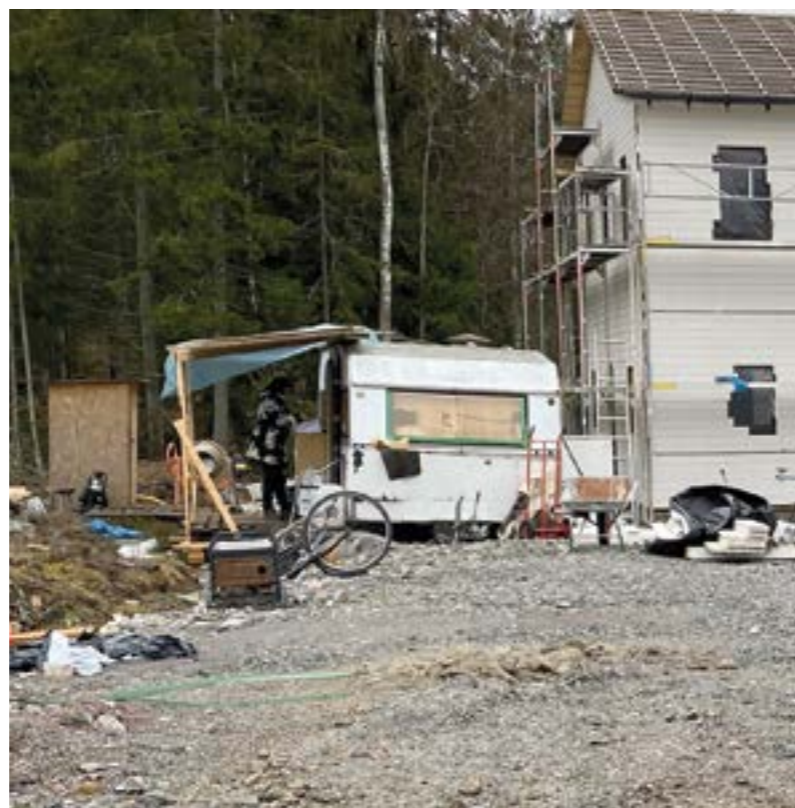
Bild 5. Boende i husvagn och toalett i skjul.