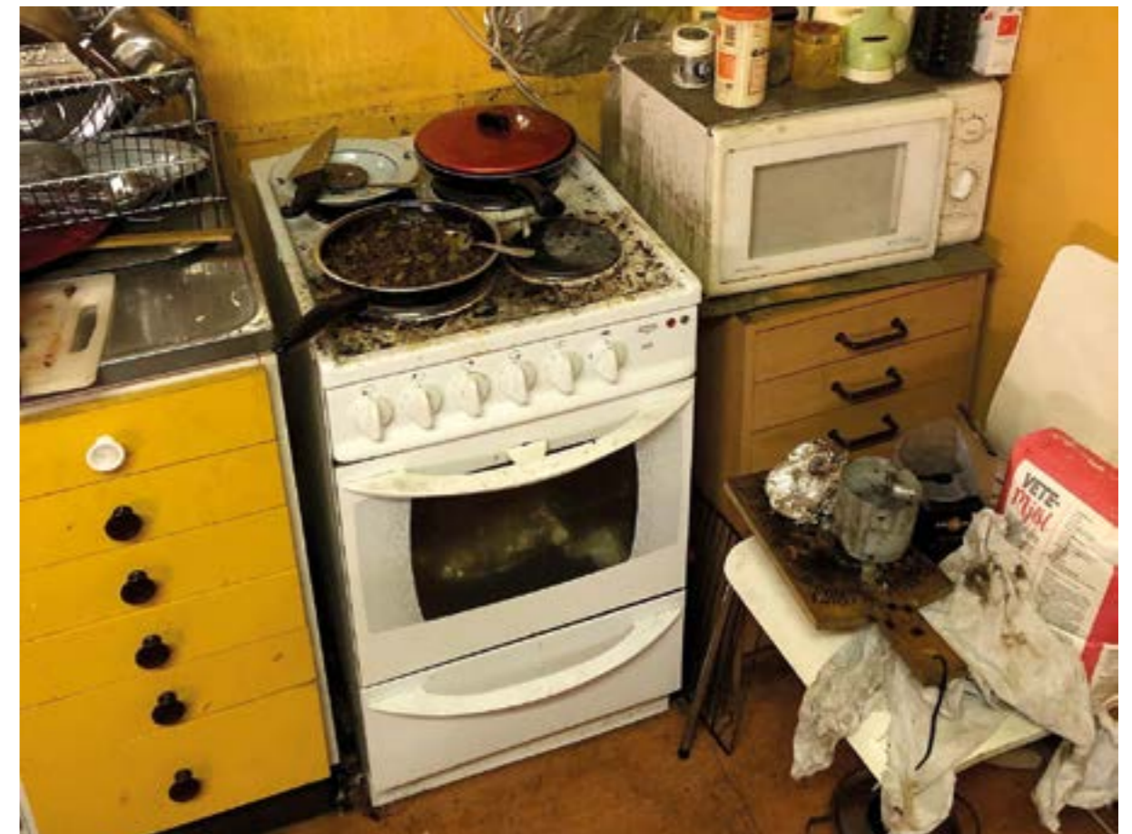
Bild 3. Kök på arbetsplats