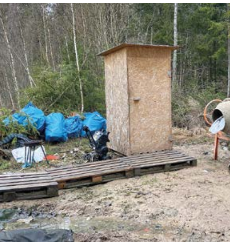
Bild 4. Skjultoalett för arbetare vid boendet.

Samhället står dessutom inför en stor utmaning i norra Sverige där stora satsningar görs när det gäller utbyggnad av infrastruktur och stora industrier. Myndigheterna behöver, både i ett tidigt skede och löpande, bistå med förutsättningskapande insatser. Detta samtidigt som brottsförebyggande åtgärder och kontroller genomförs.